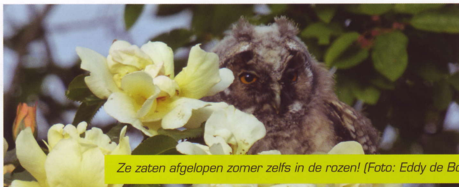
Ze zaten afgelopen zomer zelfs in de rozen!

Maar liefst 1849 ransuilen werden er geteld op in totaal 159 roestplaatsen (zie Tabel). Het kaartje laat de verspreiding over onze provincie zien. Zo'n 80% van alle uilen zit in het gebied ten wes-